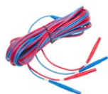
Cable de dos hilos (10 / 25 A) U1/ I1 6 m / 10 m / 15 m WAPRZ006DZBBU111 WAPRZ010DZBBU111 WAPRZ015DZBBU111