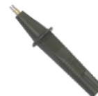
2x sonda Kelvin de dos puntas (toma tipo banana) WASONKEL20GB