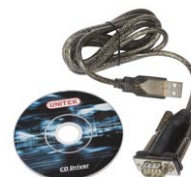
Cable de transmisión en serie RS-232 WAPRZRS232