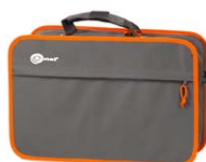
Funda L1 WAFUTL1