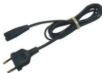
Cable de alimentación 230 V (conector IEC C7) WAPRZLAD230